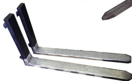
Fourches avec revêtement inox et tôle antidérapante inox