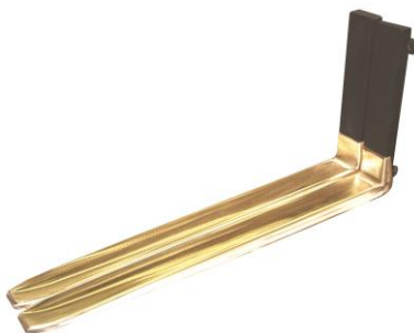
Fourches ADF (laiton)