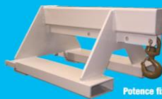
Potence fixe enfourchable