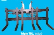
Triple TDL, intégré