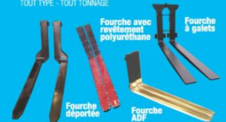
Fourche avec revêtement polyuréthane